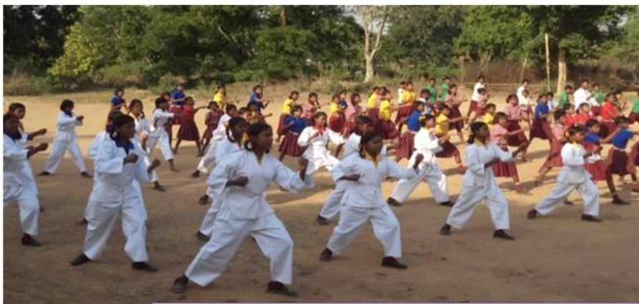
A glimpse of Karate classes for the children

Ongeveer 80 kwetsbare en gemarginaliseerde meisjes en vrouwen uit nabije dorpen worden in het centrum geholpen.