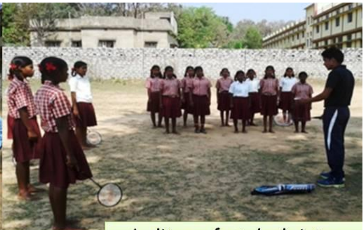
A glimpse from badminton