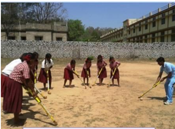
A Glimpse of Hockey Session

Spelen en activiteiten in de school ingericht en in het home om talenten en kwaliteiten te ontwikkelen.